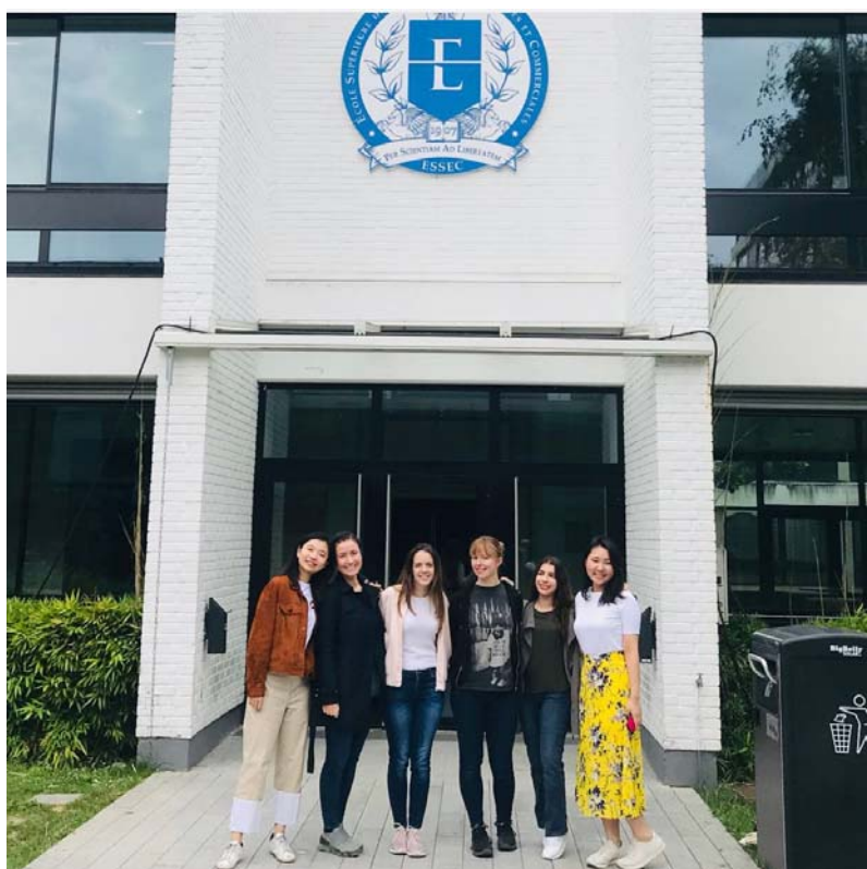
中法班学生在法国 ESSEC 商学院与法国学生合影

地址：同济大学经济与管理学院同济大厦 A 楼 1301 大厅，上海市四平路 1500 号，200092