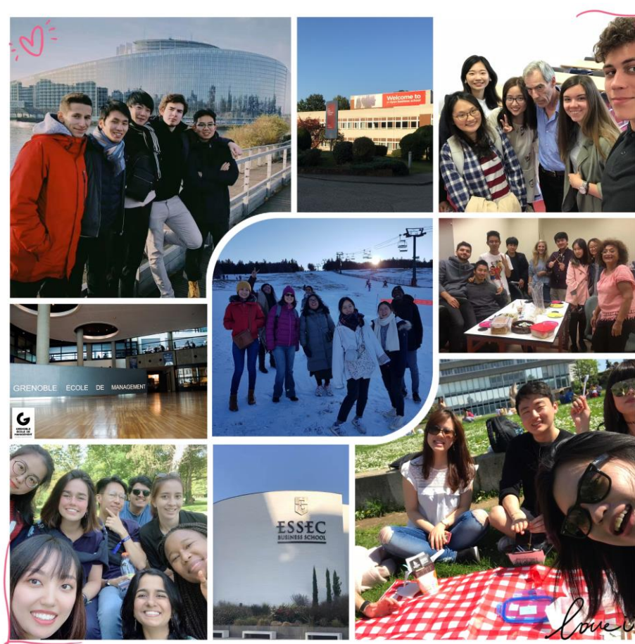
中法班学生在法国商学院与法国学生合影

地址：同济大学经济与管理学院同济大厦 A 楼 6 楼本硕博中心，上海市四平路 1500 号，200092